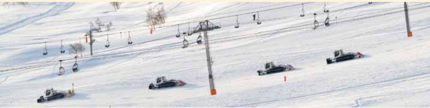
Le ballet des dameuses sur les pistes de L'Alpe d'Huez (Isère). Les stations de sports d'hiver offrent de nombreux emplois saisonniers pour l'entretien des pistes et le fonctionnement des remontées mécaniques.