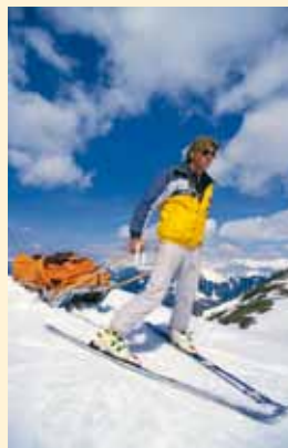
Pisteuse-secouriste descendant un skieur accidenté sur un traîneau.

L'accès à ces métiers est large, depuis le CAP jusqu'au BTS ou au DUT, en passant par le bac pro commerce, les diplômes généralistes nécessitant souvent des formations complémentaires spécifiques pour répondre à la technicité du matériel d'alpinisme, de randonnée, de sports d'hiver, etc. Il existe aussi un diplôme d'études universitaires scientifiques et techniques (DEUST) animation et commercialisation des services sportifs à l'université de Montpellier 1 (bac + 2) et quelques licences pro (dont une sur la commercialisation des produits et services sportifs à l'université de Savoie). Guide de l'université de Savoie : + 33 (0) 479 75 94 15, www.univ-savoie.fr offre-formation.univ-montp1.fr