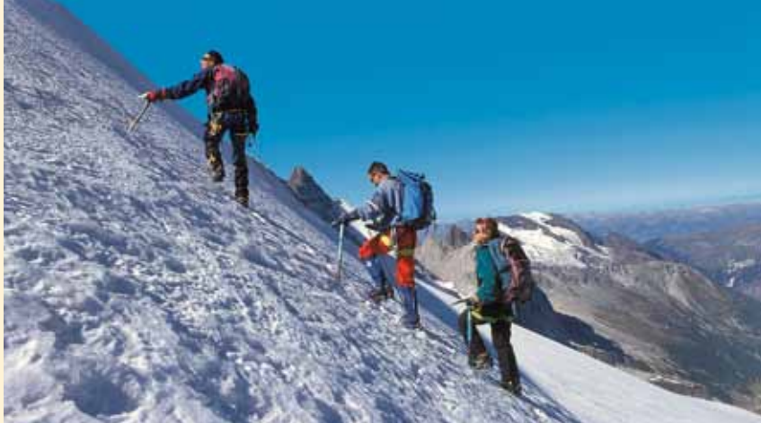
Guide menant une cordée vers le sommet en Vanoise (Savoie).